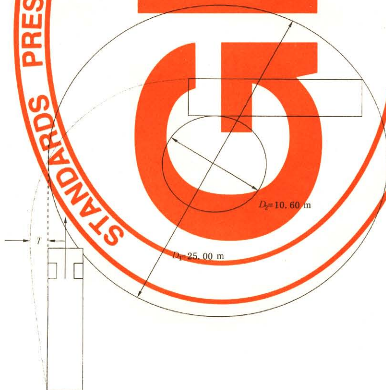
图 A.1 车辆通道圆与外摆值示意图(汽车)